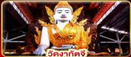
วัดงาทัดจี

สักการะ 3 มหาบุชาสถาน พักบนอินทร์แวน 1 คืน