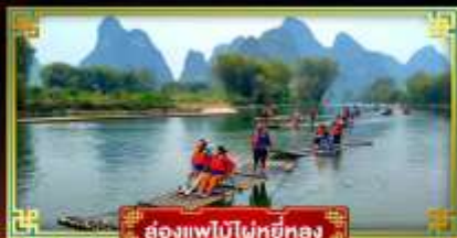
ล่องแพไม้ไผ่หยี่หลง