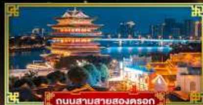
ถนนสามสายสองตรอก