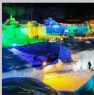
"SOUNKYO ICE FEST"