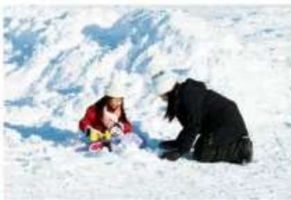
Playing in the snow