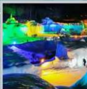
"SOUNKYO ICE FEST"